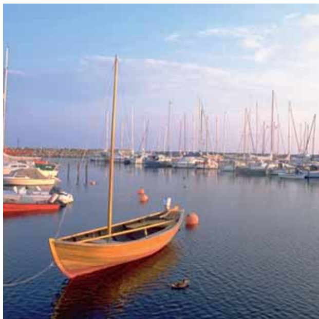
Småbåtshamnen i Ystad

Ystad har utvecklat mycket hög kompetens inom produktutveckling, marknadsföring och service, så att man kan möta olika besökskategorier med den professionalism som idag krävs.