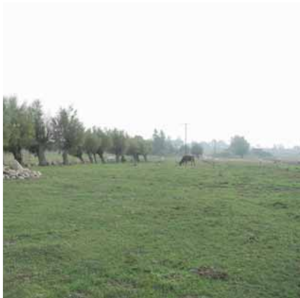
Värnorna vid Fårarp

Ett ålderdomligt kulturlandskap med ängs- och hagmark, som har stora botaniska värden. Här finns ett flertal fridlysta örter. Området bör skyddas som naturreservat så att det kan bevaras och hävdas som hitills.