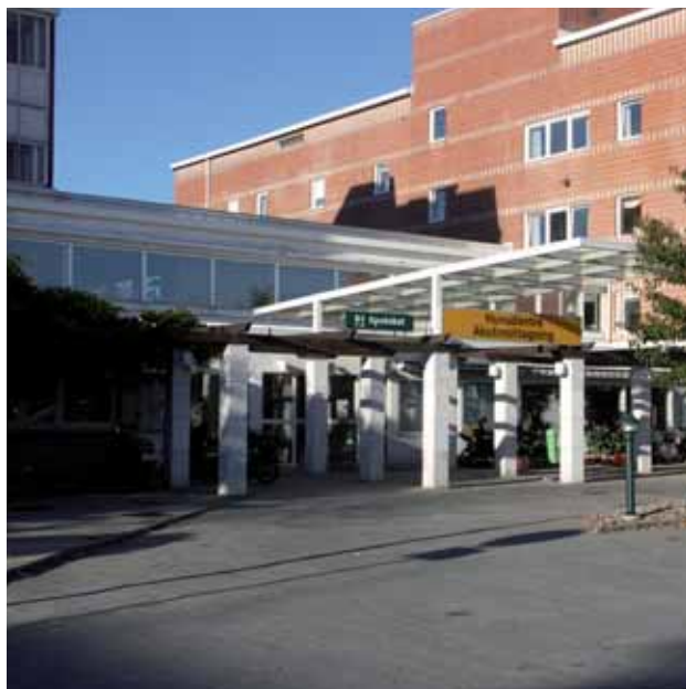
Lasarettet i Ystad

Ystadsregionens sjukhus har stärkt sin roll och blivit känt, inte bara för att vara Skånes vänligaste sjukhus utan även för den kvalificerade vården. Region Skåne har ansvaret för sjukvården och i nära samarbete med kommunen utvecklas närsjukvården. Hemsjukvården ingår i närsjukvården och ger en kvalificerad sjukvård i hemmen.