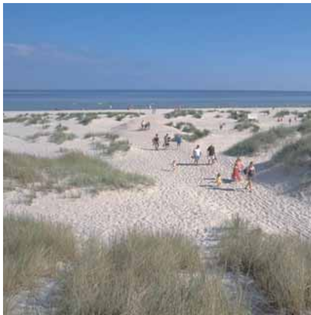
En av våra fina stränder vid Sandhammaren

Övertygelsen om att kretslopp är det enda sättet att långsiktigt lösa miljöfrågorna har fått genomslagskraft såväl i näringslivets som i hushållens och den enskilde individens vardag.