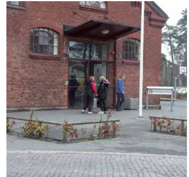
Kunskapsskolan, Regementsområdet i Ystad

Barnomsorgen är mer flexibel än tidigare och har anpassats till de nya förutsättningarna på arbetsmarknaden.