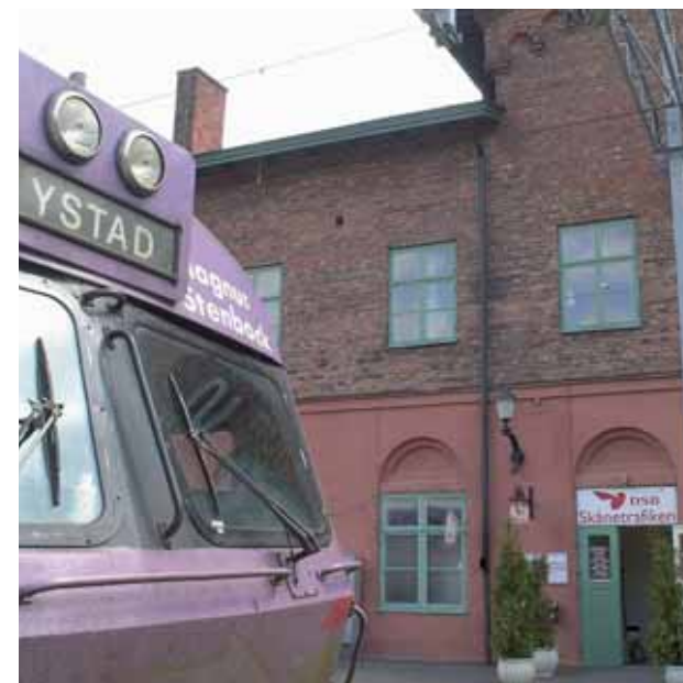
Pågatågsstationen i Ystad

Ystad har direkt järnvägsförbindelse med Köpenhamn, Malmö och Simrishamn.