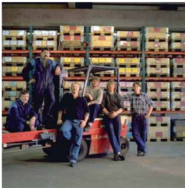
Aktiv personalpolitik skapar attraktiva och trivsamma arbetsplatser

Sedan kommunerna fått huvudansvaret för arbetsmarknadsfrågorna har snabba och flexibla åtgärder tillsammans med övergång från traditionella arbetsmarknadsinsatser till offensiva näringslivs- och utbildningsinsatser inneburit att den öppna arbetslösheten är lägre än för genomsnittet i Skåne. Ingen går sysslös längre än två veckor. Allt fler får ”riktiga arbeten” och ingen under 25 år får socialbidrag.