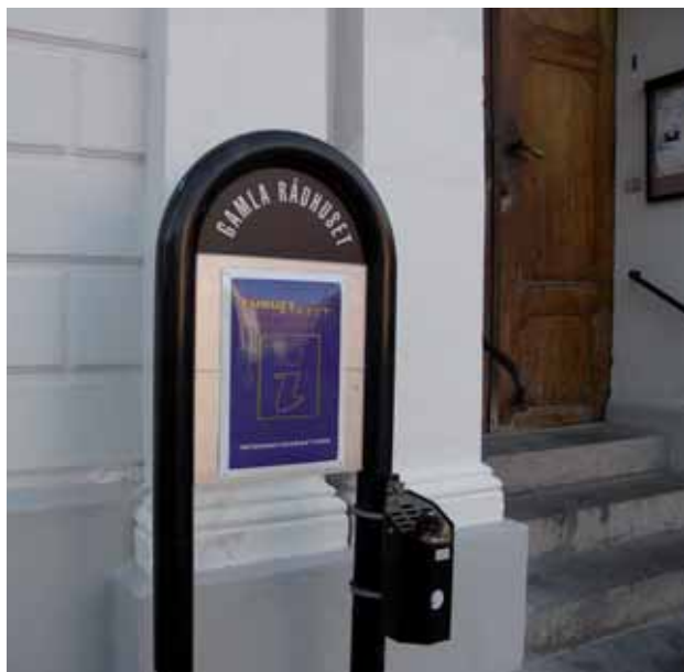
Europe Direct, informationsnätverk i Gamla Rådhuset, Ystad

I södra Östersjöregionen har Ystad och Skåne ett väl utvecklat ekonomiskt och kulturellt samarbete med Bornholm, Själland, Fyra Hörn (sydöstra Skåne samt öarna Bornholm, Wollin och Rügen) och Pomeraniaregionen (västra Pommern i Polen och Mecklenburg-Vorpommern i Tyskland).