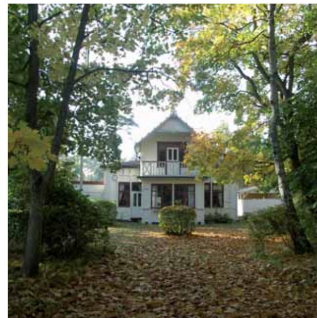
Stuga i Ystads Sandskog

Med hänsyn till bestämmelserna i bl.a. 3 kap. 4 § Miljöbalken är möjligheterna att planera nya områden för fritidsbostäder i kommunen ytterst begränsade. I Ystads kommun finns endast två ”renodlade” områden avsedda för fritidsbebyggelse, Löderups strandbad och Ystads Sandskog.