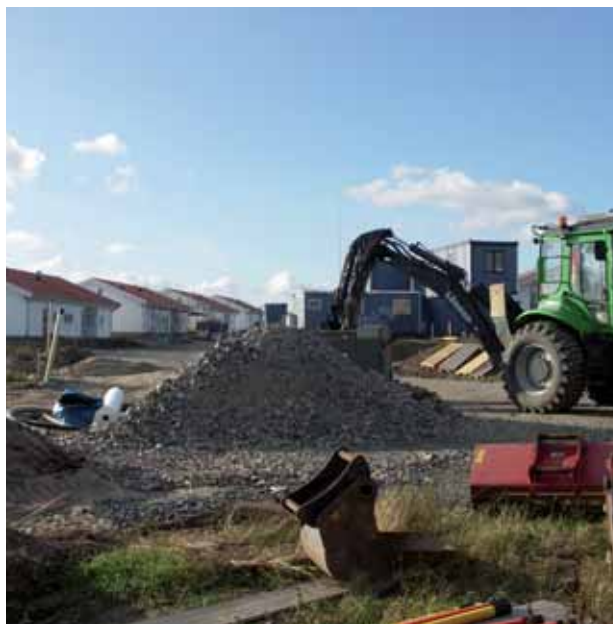
Byggarbetsplats i Västra Sjöstaden

Efter 90-talets kris i byggnadsbranschen produceras ca 150 bostäder årligen. Bostäderna och bostadsmiljön håller mycket hög kvalitet, vilket är ett starkt skäl till att Ystad är en attraktiv inflyttningskommun. Jämställdhet är en ledstjärna i samhällsplaneringen. Stor omsorg läggs på stadens identitet och de befintliga miljöernas historik vid planering av nya bostadsområden. Jämställdhets- och tillgänglighetsfrågor beaktas alltid. Ystad är känt både för sina välbevarade byggnader och för sin moderna arkitektur.