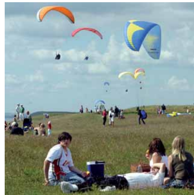
Luft under vingarna i Ystad

Efter en svacka i slutet av 1990-talet har Ystads kommun fortsatt att växa med 1% per år, vilket innebär att här bor ca 29 250 invånare år 2012. Åldersstrukturen har förändrats så att medelåldern sänkts och tidigare födelseunderskott förbytts mot ett mindre årligt överskott. Till en del kan den positiva befolkningsutvecklingen tillskrivas kommunens målmedvetna och långsiktiga marknadsföringsarbete.