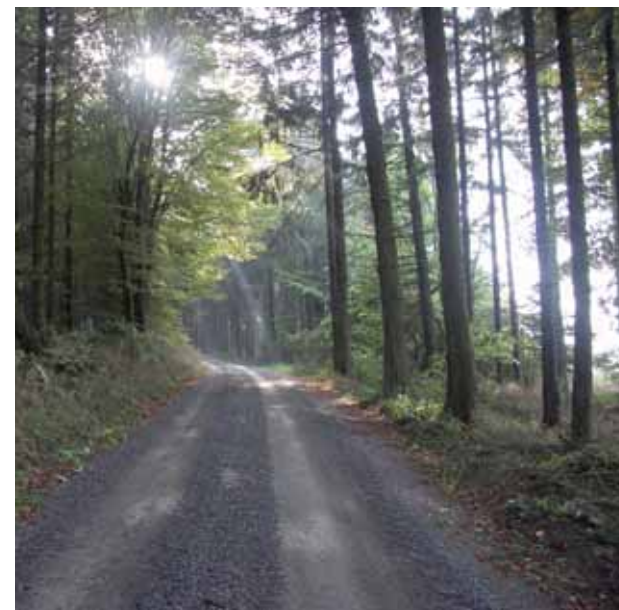
Föreslaget naturresevat vid Nyvångsskogen

I Ystads kommun finns flera områden med mycket stora naturvärden. I avsnitt 14. NATURVÅRD i underlagsmaterialet redogörs noggrant för dessa områden och på restriktionskartan finns samtliga områden med förordnanden enligt Miljöbalken redovisade. I detta kapitel beskrivs endast föreslagna naturresevat.