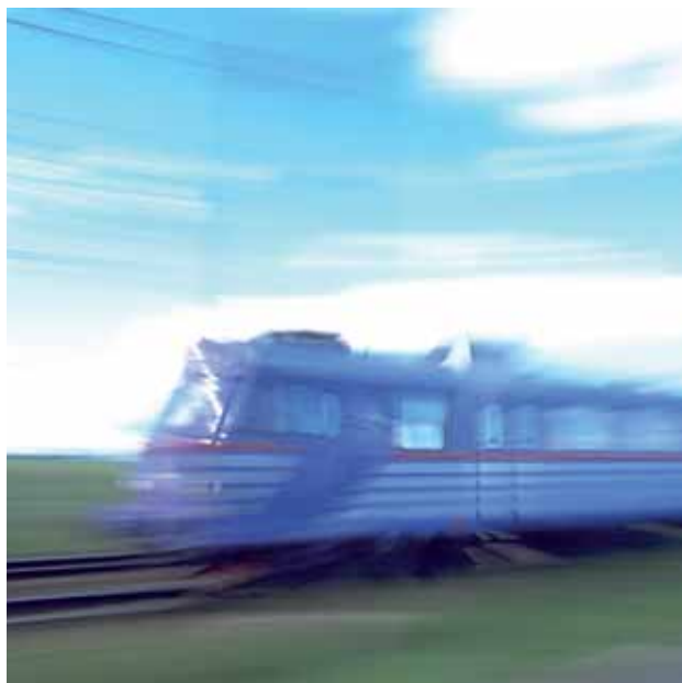
Väl utbyggda och snabba kommunikationer främjar resandet

Öresundsbron och de nya intercitytågen innebär att man bekvämt åker till Kastrup/Köpenhamn på en timme, vilket uppskattas inte minst av alla resenärer mellan Köpenhamn och Bornholm.