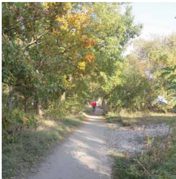
Cykelväg i Ystads Sandskog

De flesta tätorter i kommunen har ett väl utbyggt cykelvägnät. Många tätorter är också sammanbundna med markvägar eller mindre trafikerade landsvägar, som är lämpliga för cykling och promenader. Tätorterna har också sådana förbindelser med naturområden och andra utflyktsmål på landsbygden. Däremot saknas förbindelser mellan vissa större tätorter samt ett sammanhängande stråk längs kusten. Kommunen planerar därför att komplettera det befintliga stråket