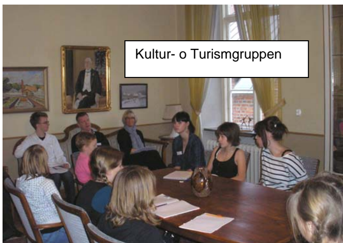
Kultur- o Turismgruppen