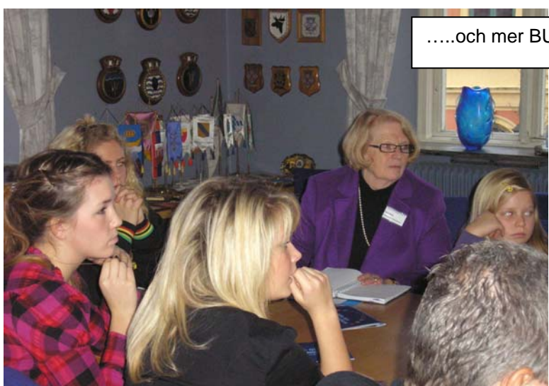
.....och mer BUN-gruppen