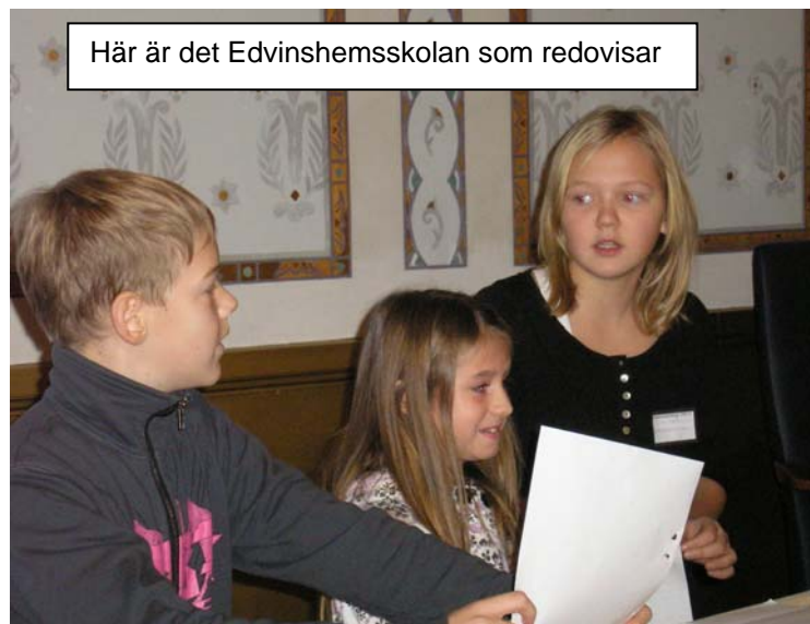
Här är det Edvinshemsskolan som redovisar

Backaskolans representanter berättade om innebandy och en melodifestival de ska arrangera till våren. För Ängaskolan har de olika klasserna olika områden vad gäller inne- och utemiljön som de ska hålla efter och de ska också arbeta med en powerpointpresentation kring Ungdomsfullmäktige.